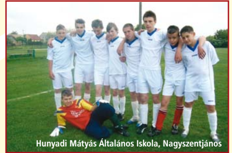
Hunyadi Mátyás Általános Iskola, Nagyszentjános