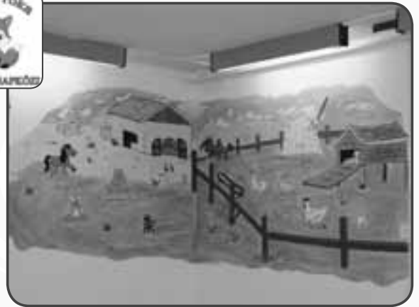
A rendkívül látványos falfestés Bothné Asztalos Szilvia védőnő keze munkáját dicséri